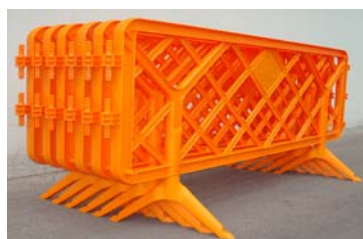
Tanques apilades en posició d'ús, sense pèrdua d'espai

Observacions: - Colors disponibles: groc, blau cel, taronja, verd, vermell, blau bilbo - Material reciclable - Possibilitat de personalitzar amb serigrafia - Peus de plàstic o metàl·lics a escollir.