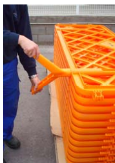
Reposició dels peus giratoris

Zona de serigrafia per a incloure logo o un altre disseny: rombe 20 x 20 cms