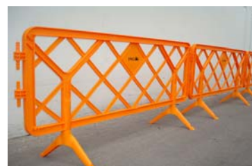
Tanques serigrafades, de fàcil anclatge