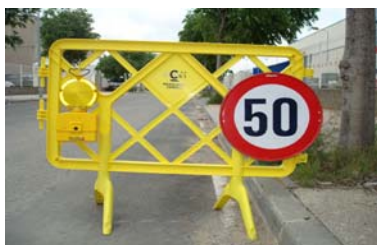
Barrière sérigraphiée avec pieds plastiques. Panneau et balise non compris