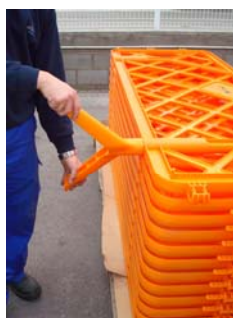
Remplacement de pieds

Zone de sérigraphie pour logo ou autre dessin: Losange 20 x 20 cm